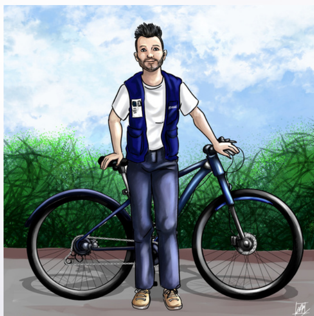
Ilustração: Aline Carneiro